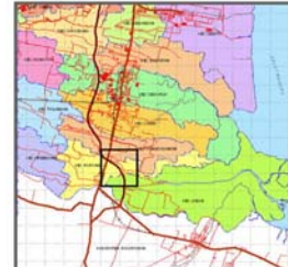
PETA AREA TIGA DESA TERDAMPAK